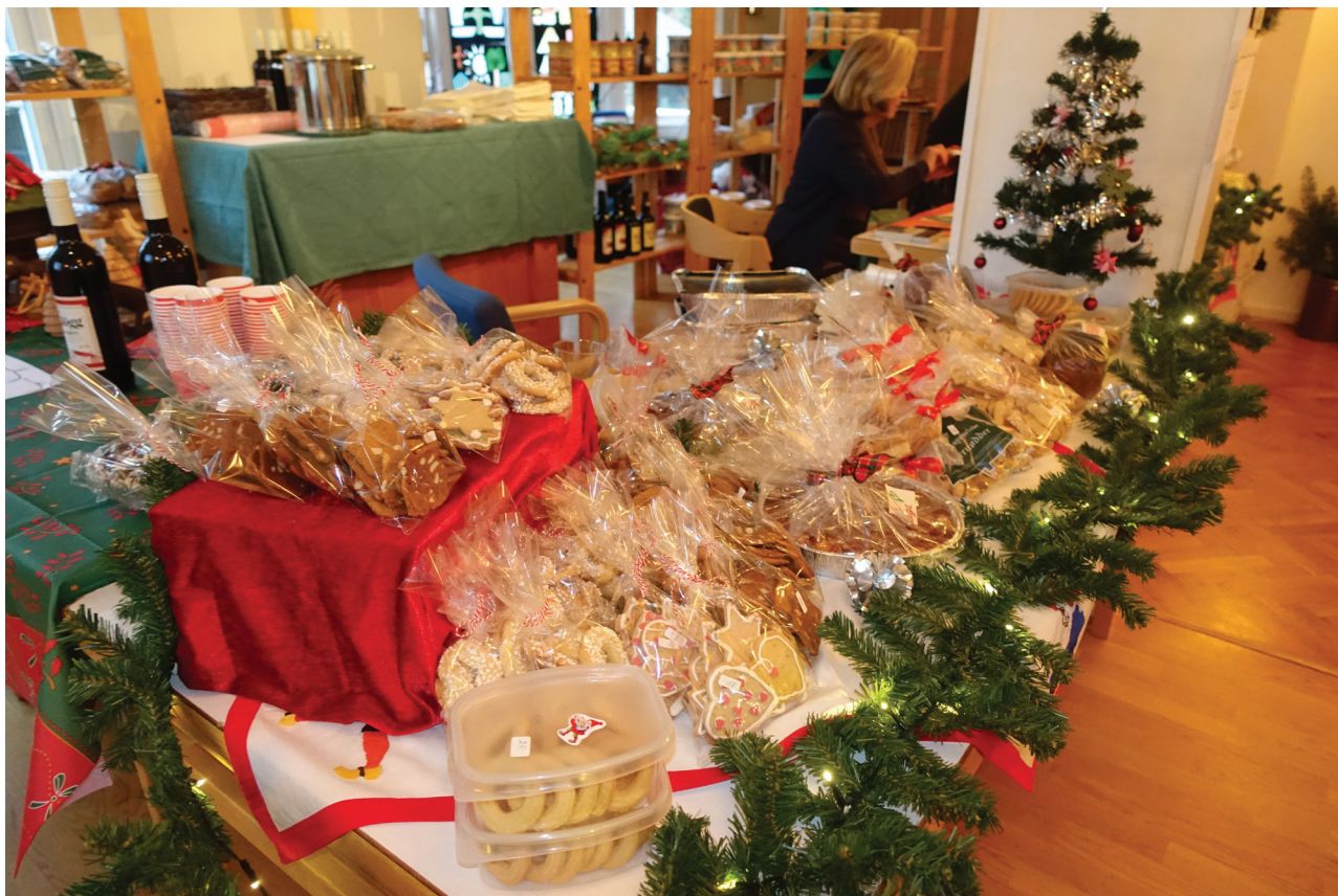
Julebasar den 17 november 2015