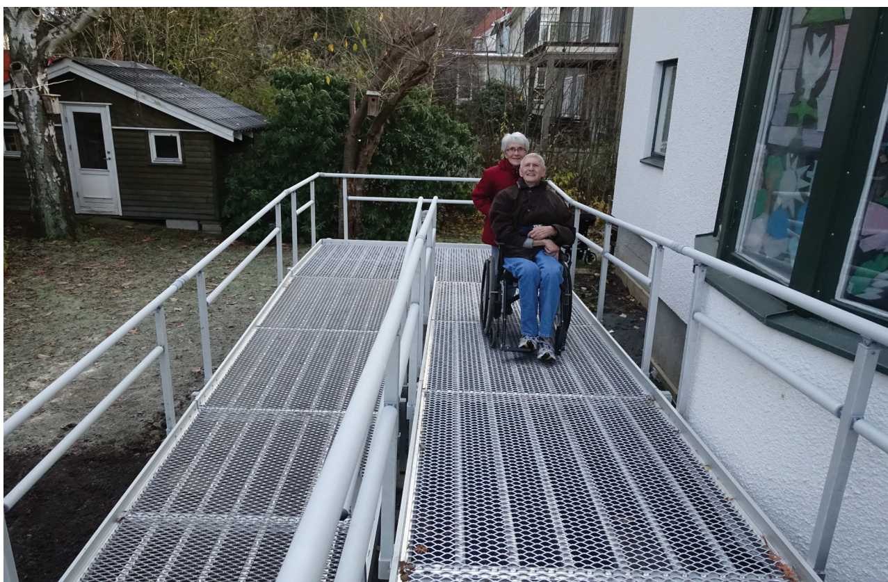
Invigning af handicapindgangen på basardagen